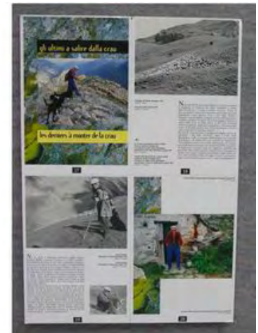
la transhumance la Routo