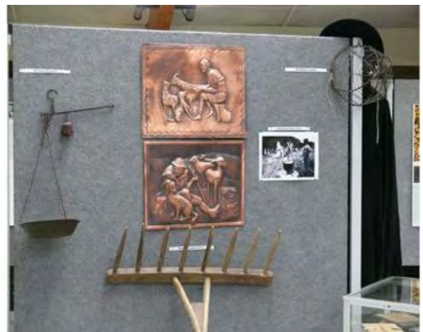
la cape et les bâtons la vie du berger